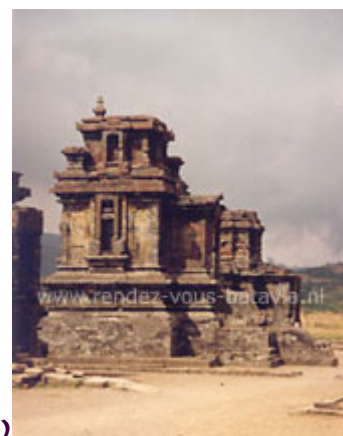
Candi Gatutkaca op het Dieng Plateau