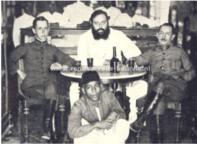
Op de mailboat naar Holland, 1925 Met verlof!

Hij bezocht direct de plaatselijke sociëteit, maakte ter plekke snel veel vrienden en vertrok in de vroege ochtenduren van de tweede juli naar zijn hotel. Vaag herinnerde hij zich dat hij zijn opwachting moest gaan maken bij zijn nieuwe superieur. Onverdroten toog Callenfels op weg naar het kantoor.